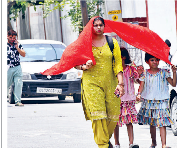
रोहतक। चिलचिलाती धूप में ममता की छांव - एक मां अपने बच्चों को सूरज की तेज किरणों से बचाते हुए रास्ते पर चल रही है, सच्चे संरक्षण और स्नेह का अनमोल दूर्य।